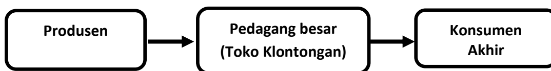
Gambar 3. Saluran Pemasaran III Tepung Mocaf Pada KWT Seroja

Saluran pemasaran III adalah cara mendistribusikan barang yang melibatkan perantara berupa pedagang besar. Prosesnya dimulai dari produsen, lalu ke pedagang besar, dan akhirnya sampai ke konsumen, yang dapat di sajikan pada gambar 3.